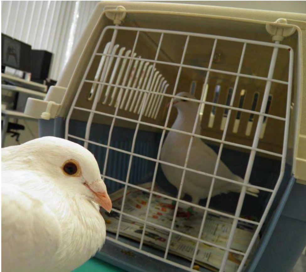
Kurzfristige Unterbringung einer Taube in einer Katzentransportbox