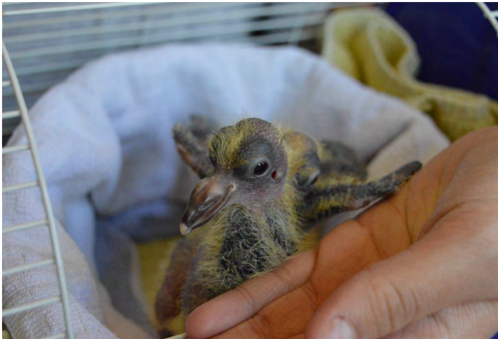
Junge Tauben im Ersatznest

Am Ende der Aufzuchtphase können die Vögel auf reines Körnerfutter umgestellt werden.