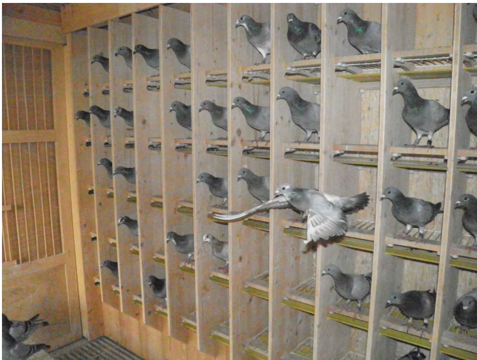
Beispiel für Sitzregale

Absitzmöglichkeiten muss es ebenfalls in ausreichender Anzahl geben. Um unnötige Rangeleien zu vermeiden, sollte jede Taube einen eigenen Sitzplatz zur Verfügung haben. Sitzgelegenheiten können zum Beispiel versetzt angeordnete Sitzstangen sein, unter denen schräge Brettchen angebracht sind, um den Kot aufzufangen. Noch besser eignen sich Sitzregale. Hier können auf gleichem Raum mehr Tauben sitzen. Sitzregale bieten auch Sichtschutz, was dem Territorialbedürfnis der Tauben gerecht wird und die Vögel beruhigt.