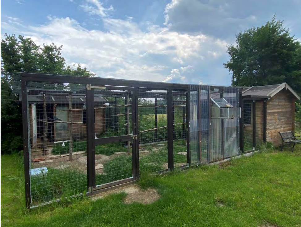
Beispiel für eine Außenvolierenhaltung