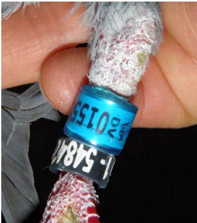
Beispiel einer beringten Brieftaube mit geschlossenem Kennungsring und offenem Telefonnummernring

Brieftaubenringe sind aus Metall und mit einer farbigen Kunststoffschicht überzogen. Dieser Ring ist stets geschlossen, damit das Tier ihn nicht verlieren kann und eindeutig zu identifizieren ist. Brieftauben können zusätzlich mit einem Telefonnummernring gekennzeichnet sein (Verbandssatzung). Dieser Ring ist offen und kann verloren gehen. Daher stempeln manche Züchter*innen die Telefonnummer zusätzlich unter die Schwungfedern (zum Beispiel bei Tauben aus den Beneluxländern).